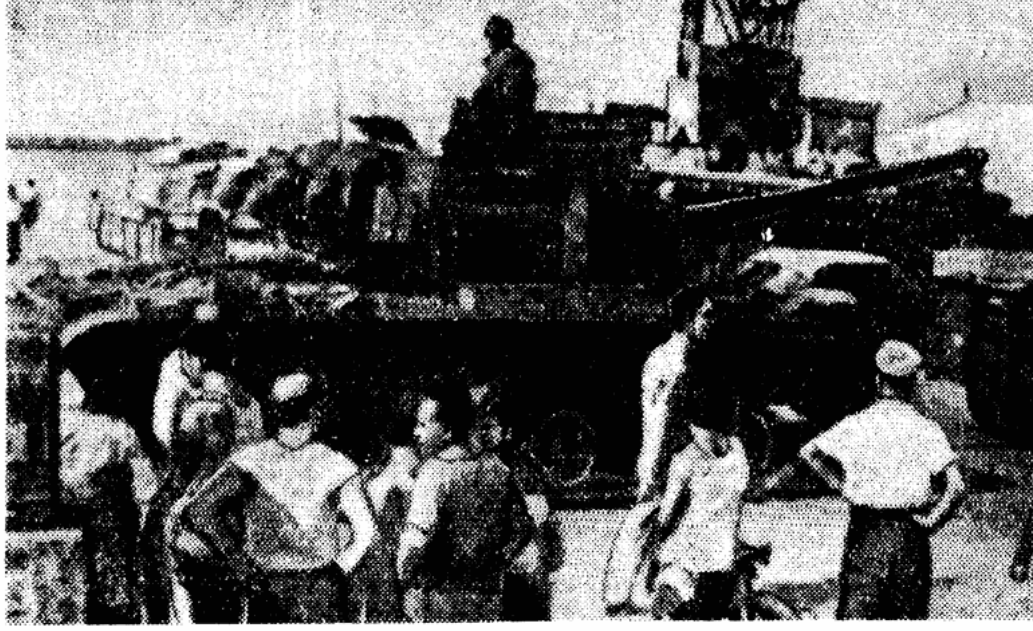
Высадка американских войск в Ливане.