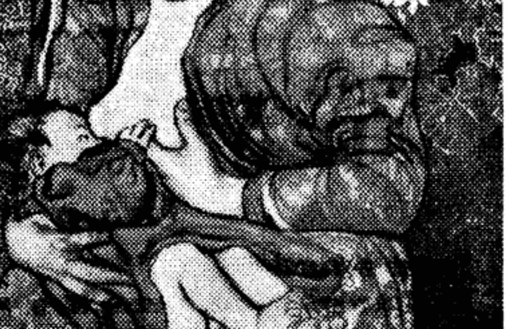
«Материнство». Пастель. 1905 год.

На детских портретах Выспяньского хочется остановиться особо. Редко кому из художников удавалось так проникновенно раскрыть обаяние детского облика, как это сделал Выспяньский в своих картинах «Спящий Стас», «Девочка в голубой