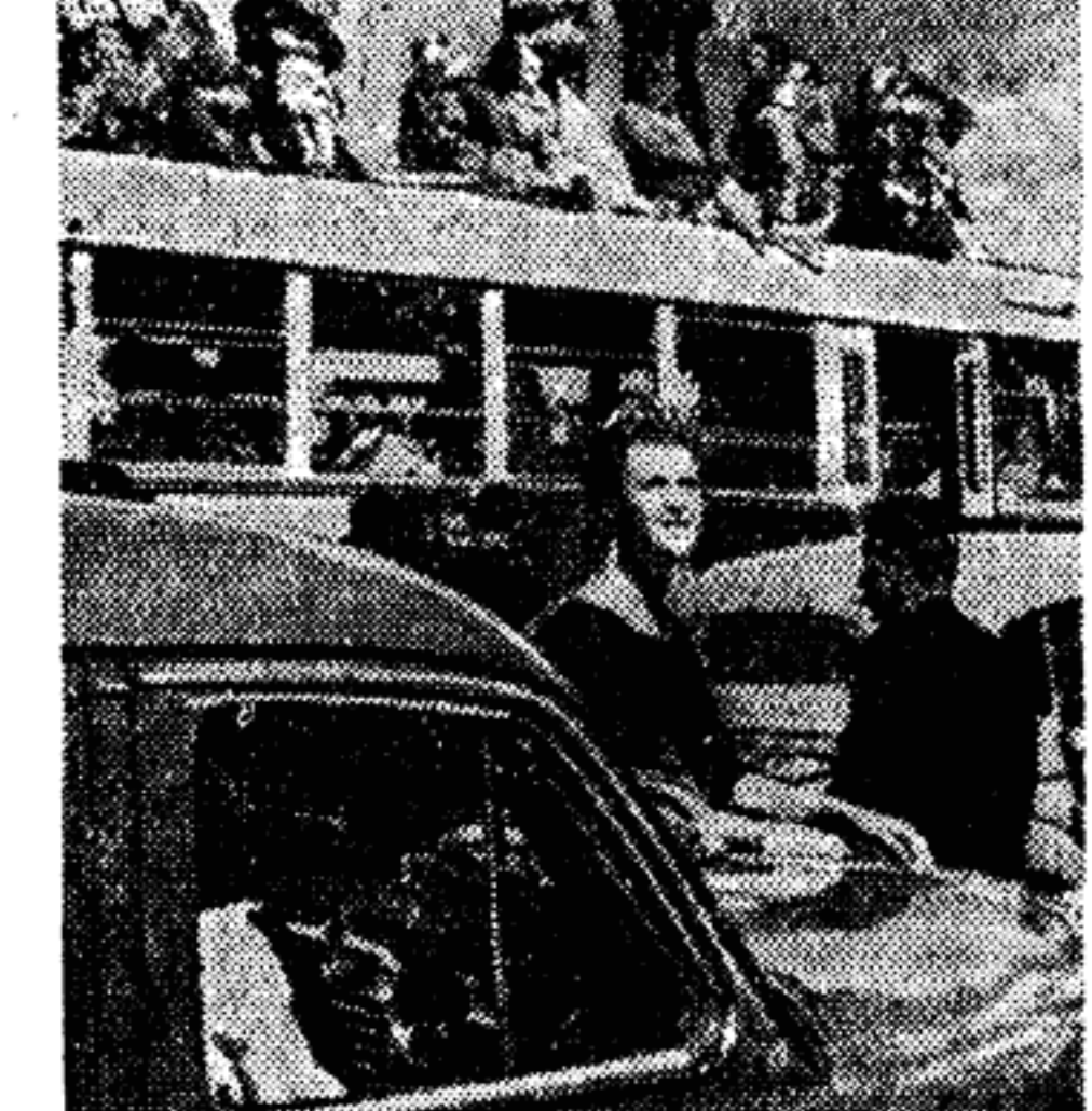
Тысячи москвичей наблюдали в Тушино за выступлениями воздушных спортсменов даже с крыш автобусов.

День Воздушного Флота СССР широко был отмечен в городах и селах Советского Союза.